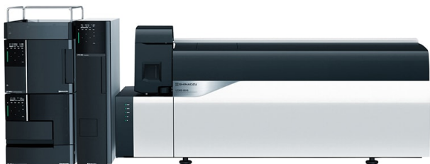
図1 Nexera™ XS with LCMS™-8045 system

測定対象のニトロソアミン6成分はすべて中極性化合物であり、イオン源には大気圧化学イオン化 (APCI) インターフェイスを使用しました。