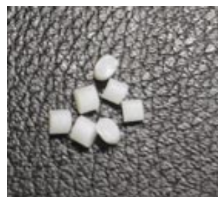
Fig.1 測定に使用したポリマービーズ Polymer beads

瞬間熱分解(Py)-GC/MS法,熱脱着(TD)-GC/MS法の設定温度はEGA(発生ガス分析)-MS法により550 , 300 (5 min)としました。測定したクロマトグラム(TIC)から添加剤成分を推定しました。