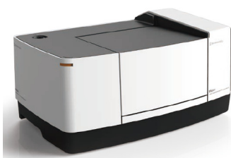
図3 コンパクト FTIR IRSpirit™