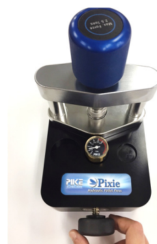
図 2 加圧の様子