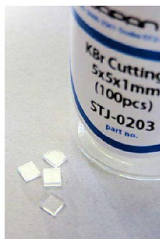
図4 KBr Cuttings

確認試験の結果、測定で得られた測定試料の赤外スペクトルにおいて、波数 3400.5 cm -1 、2940.0 cm -1 、1579.3 cm -1 、1408.6 cm -1 及び 1082.3 cm -1 の吸収を確認することができました。指定したピークとのずれは最大で 0.6 cm -1 と良好な結果が得られました。