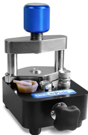
図 1 2.5 トン小型油圧プレス Pixie

図 1 に Pixie の外観を、図 2 に加圧の様子を示します。加圧は、上部青色のノブを締めて錠剤成形枠が動かないように固定した後、手前の油圧プレスノブを回して行います。圧力ゲージを確認しながら加圧の微調整が可能です。